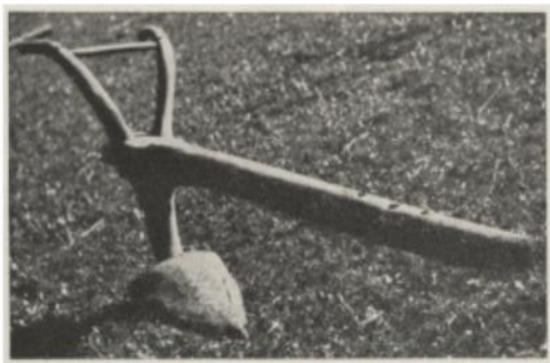
Valašský hák z Halenkova, Šťastný (1958)