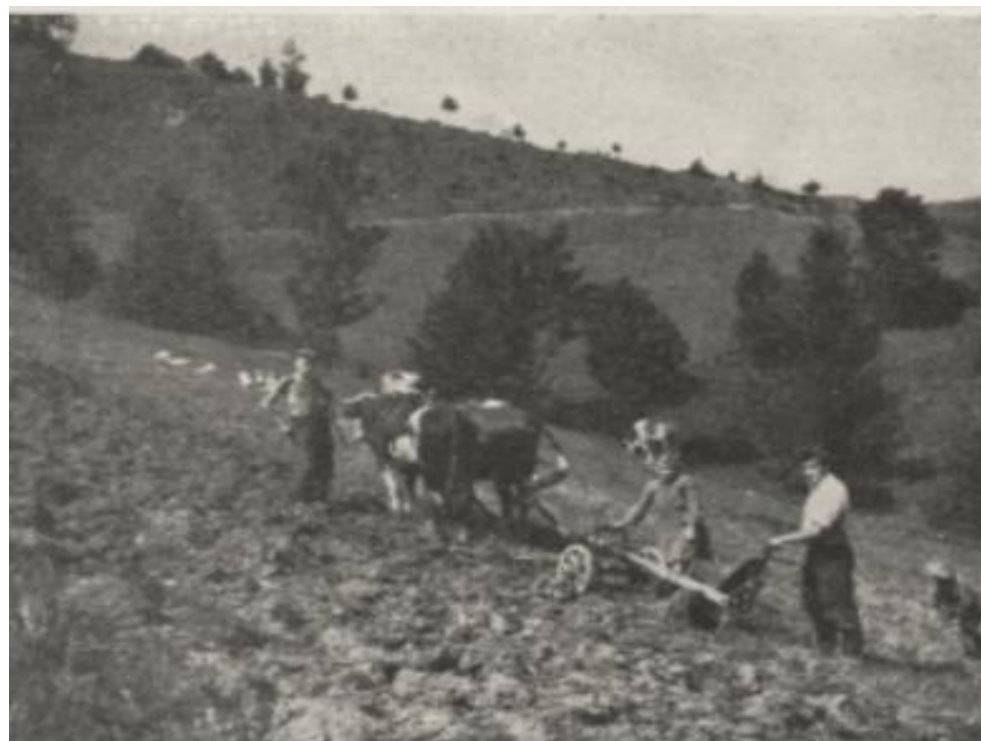
Novější typ dvojradličného pluha z Halenkova, Šťastný (1958)